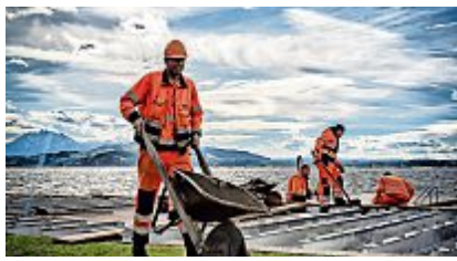
Werkhofmitarbeiter der Stadt Zug erstellen die Beplankung des neuen Liegerosts in der Badi Seeliken. Christof Theiler

An den Holzlatten und an der Unterkonstruktion aus Holz hinterliessen Wetter und Seewasser in der Badi Seeliken ihre Spuren: Die Balken wurden morsch. Aus diesem Grund wurde in einer ersten Etappe der nördliche Holzrost der Badi Seeliken in den vergangenen Wochen ersetzt.